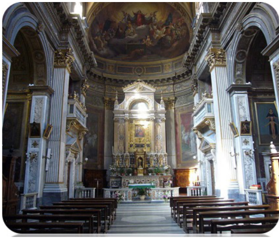
Iglesia de Santa Lucia del Gonfalone

P. FRANCO INCAMPO, CMF | Comienzan las obras de construcción de la Iglesia a finales del siglo XIII y principios del siglo XIV, bajo el nombre de Santa Lucia Nuova, tal y como atestiguan documentos de 1352 y de 1371, para distinguirla de la Iglesia de la antigua Santa Lucía, cerca del Tíber. Luego fue reconstruída en 1511 y confiada a la Archicofradía del Gonfalone. Fue sometida a diversas restauraciones en los años 1603, en 1764 y en 1866. En esta última ocasión, Francesco Azzurri decoró su interior.