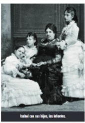
Isabel con sus hijos, los infantes.

H abíamos dejado al arzobispo Antonio María Claret en Medina de Rioseco acompañando a Isabel II en 1851. Así lo describe el Libro Becero del convento de San José de las madres carmelitas descalzas de aquella localidad: "nos dijo la Mesa, un buen rato pasó al locutorio, tomó chocolate, llamó a la Comunidad, nos quedamos admiradas de ver a aquella persona tan venerable su rostro de un santo y su palmar del cielo". Las moradas le podían darse pronto en Medina de Rioseco con sus misioneros, "que no nos arreglábamos con las curas para nuestra dirección y nos respondieron: si, si, tened paciencia que yo vendré". Cuando conoció la iglesia muy deteriorada del antiguo templo de los dominicos, dice la tradición que el padre Claret pronunció que allí predicar en su día sus misioneros y allí, llegaron en julio de 1854, veinticuatro años después de su muerte. Pasó después de las carmelitas a las claustrales. Después de la plática le entregó la media y cada una de recuerdo. A la vuelta de aquel verano se detuvieron en Tordesillas, un 17 de septiembre, procedentes de Benavente.